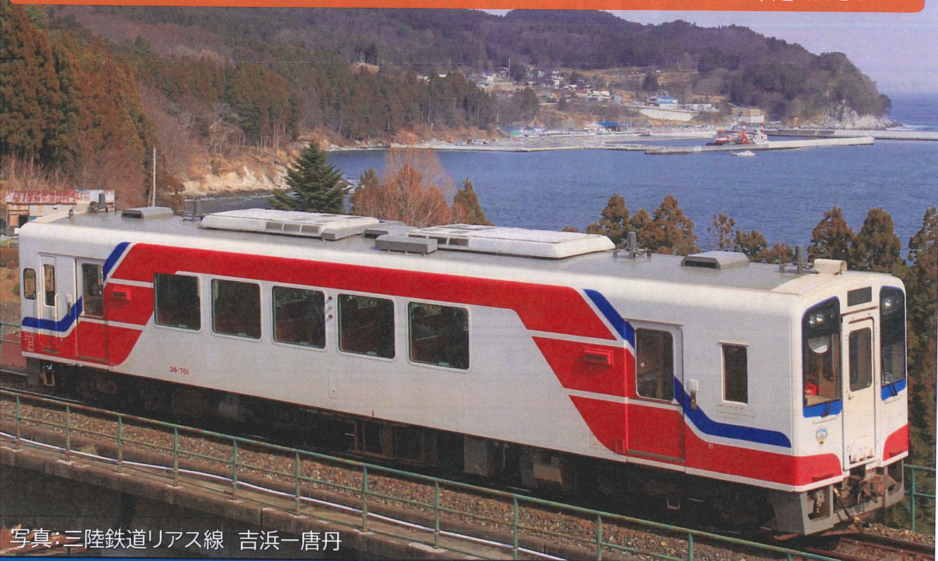
写真: 三陸鉄道リアス線 吉浜-唐丹

2024/4/1→2025/3/30ご出発分まで ※ご出発の7営業日前までにお申込ください